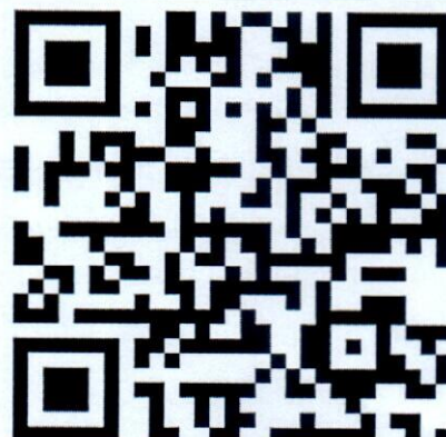
Mã QR Thẻ lệ Cuộc thi