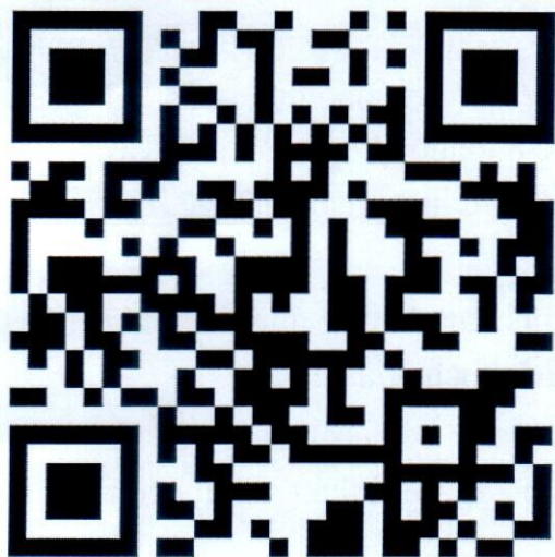
Mã QR thi quý II

- Kế hoạch, Thẻ lệ và câu hỏi quý II được đính kèm theo công văn.