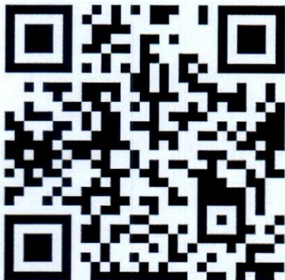
Mã QR thi tháng 4

- Thẻ lệ và câu hỏi Tháng 4 được đính kèm theo công văn.