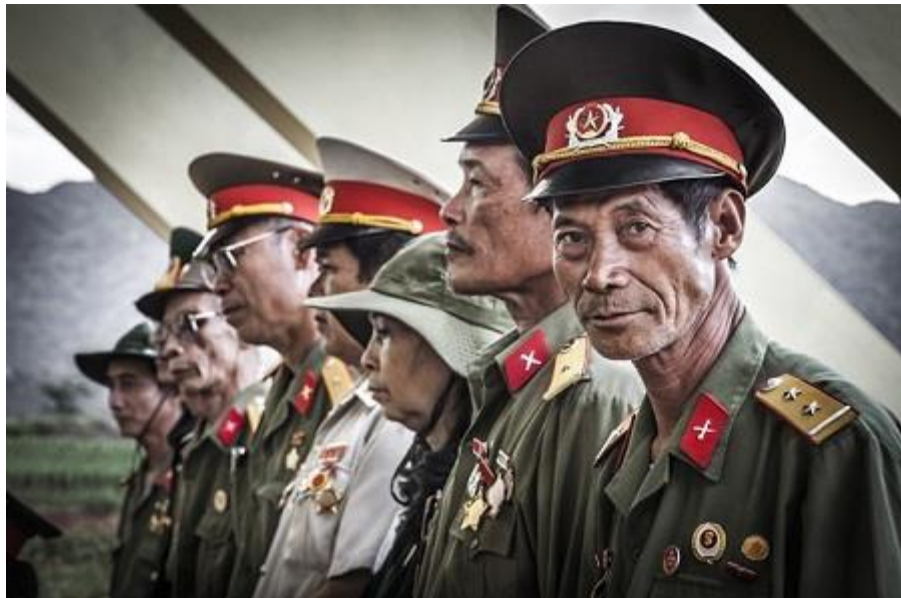
Bức ảnh chụp cựu chiến binh Việt Nam do nhiếp ảnh gia người Tây Ban Nha - Sergio Diaz thực hiện

Trải qua nhiều cuộc kháng chiến gian nan và cả những hy sinh để bảo vệ độc lập cho đất nước. Chính vì vậy, để đáp ứng nguyện vọng của đông đảo Cựu chiến binh Việt Nam, Bộ Chính trị, Ban Chấp hành Trung ương Đảng (khóa VI) đã quyết định cho thành lập Hội Cựu chiến binh Việt Nam vào ngày 6/12/1989.