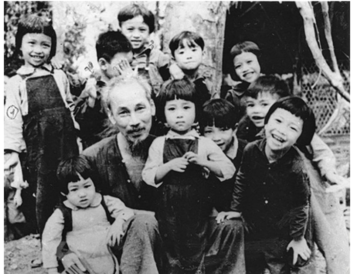
Bác Hồ đến thăm trường mẫu giáo nội trú đầu tiên của quân đội tại Việt Bắc nhân dịp sinh nhật của Người, ngày 19-5-1953.

Học tập và làm theo phong cách sống thanh cao, trong sạch, giản dị và tinh thần “ dĩ công vi thượng ” của Bác, cán bộ, chiến sĩ quân đội luôn kiên định mục tiêu, lý tưởng chiến đấu, gương mẫu, đi đầu trong chấp hành chủ trương, đường lối của Đảng, chính sách, pháp luật của Nhà nước, kỷ luật quân đội; đề cao tự phê bình và phê bình; đoàn kết nội bộ, đoàn kết nhân dân; kiên quyết đấu tranh với các hiện tượng tiêu cực, tham nhũng, lãng phí, quan liêu, bệnh thờ ơ, vô cảm, sùng bái cá nhân; ra sức xây dựng cơ quan, đơn vị chính quy, xanh, sạch, đẹp, có môi trường văn hóa tốt đẹp, lành mạnh; xây dựng tổ chức đảng trong sạch vững mạnh; cơ quan, đơn vị vững mạnh toàn diện; các tổ chức quần chúng vững mạnh xuất sắc.