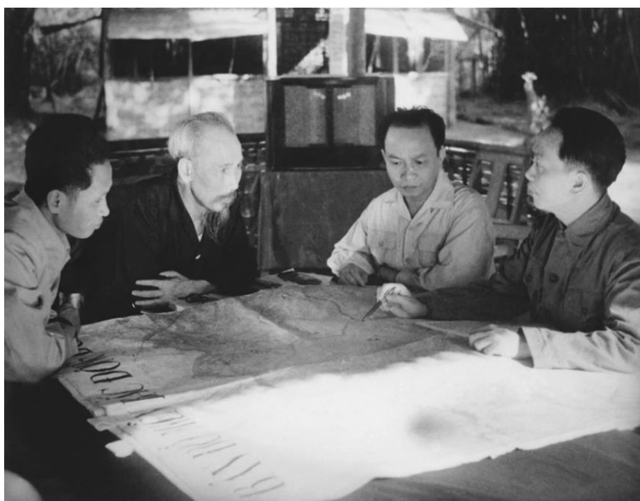
Chủ tịch Hồ Chí Minh và các đồng chí trong Ban Thường vụ Trung ương Đảng họp quyết định mở Chiến cuộc Đông Xuân 1953-1954 và Chiến dịch Điện Biên Phủ (tại xã Phú Đình, huyện Định Hóa, tỉnh Thái Nguyên cuối năm 1953).

Trên cơ sở phân tích âm mưu của địch và khả năng của ta, Chủ tịch Hồ Chí Minh khẳng định: địch tập trung quân cơ động để tạo nên sức mạnh, ta buộc chúng phải phân tán lực lượng thì sức mạnh đó không còn.